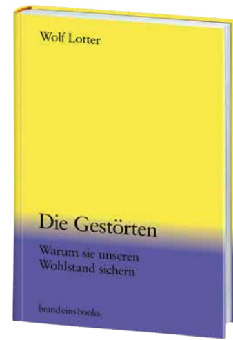
Wolf Lotter Die Gestörten

20,00 € (D) / 20,60 € (AT) ISBN 978-3-98928-010-6