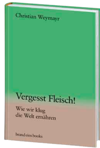
Christian Weymayr Vergesst Fleisch!

20,00 € (D) / 20,60 € (AT) ISBN 978-3-98928-009-0