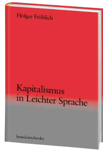
Holger Fröhlich Kapitalismus in Leichter Sprache

20,00 € (D) / 20,60 € (AT) ISBN 978-3-98928-008-3