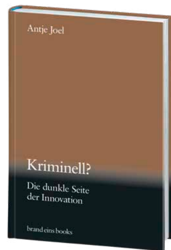
Antje Joel Kriminell?

20,00 € (D) / 20,60 € (AT) ISBN 978-3-98928-012-0